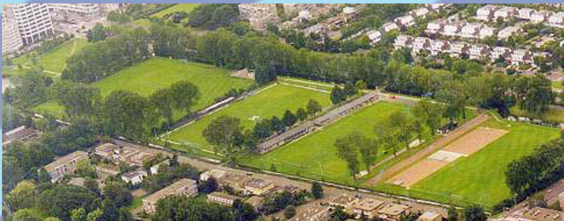
De (gras)velden aan de Prins Bernhardlaan op een luchtfoto uit 2001

Uit ervaring bij andere fusieclubs bleek achteraf dat fusies vaak stuk liepen op de naam en de kleur, omdat de clubs daar altijd aan gehecht waren. Er werd daarom voor een naam gekozen (Forum Sport), die niet kon worden afgeleid van één van de twee verenigingen. De naam "Forum Hadriani" heeft twee betekenissen. De naam had een historische link met het oude Voorburg, dat zo in de tijd van de Romeinen heette. En "Forum" staat ook voor centrum, of marktplaats. Een ontmoetingsplaats dus zeg maar. Hiermee kwam de centrale ligging van Sportpark 't Loo in Voorburg in de naam terug. De Voorburgse Prins Bernhardlaan, het complex van SV Voorburg, werd het onderkomen van de nieuwe fusieclub.